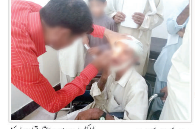
ڈاکٹروں پر بہت اعتماد تھا، معائنے کے دوران اکثر مریض اس بات پر خوش دکھائی دے دیے کہ انہیں چیک اپ کروانے اور علاج کے لیے کراچی نہیں جانا پڑا۔ دوسرے روز شام تک یہ سلسلہ چلتا رہا، شام تقریباً ساڑھے پانچ بجے ہی بی بی ایچ یو کی ٹیم نے کراچی واپسی کا سفر شروع کیا مکمل ہوئی۔ علی الصباح ٹیم کراچی پہنچی۔

تھے ان کی رجسٹریشن رضا کار خود روز بھی زیادہ تعداد خواہ تین کی ہی تھی۔ کرتے اور ان کو ڈاکٹر تک بھی خود جس میں سے 9 کا موٹیا کا آپریشن لے لے جاتے اور پھر ہسپتال کے ہوا۔ وہاں کے مریضوں کا کراچی کے