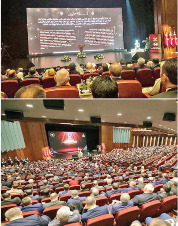
یہ مناظر اس باوقار اور پر شکوہ تقریب کے جوں جوں جری کے دار الحکومت انفرہ میں خدمت خلق کے لیے کام کرنے والے کارکنان کے اعزاز میں منعقد کی گئی، ایک تصویر میں قرآن کریم کی وہ آیت اور اس کے ترجمے پر مشتمل کتابچہ بھی واضح نظر آ رہا ہے جس میں ایمان والوں کی دیگر علامات کے ساتھ خدمت خلق کی صفت کا بھی ذکر ہے

مشغول رہنے والوں کے اعزاز میں مارچ کو منعقد ہوتی ہے، دار الحکومت منعقد کی گئی، یہ تقریب ہر سال 13 انفرہ میں باقی صفحہ نمبر 3 تقریب نمبر 06