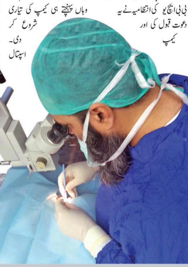
کیمپ کے بعد B B H U نے گوارڈریٹ میں آئی کیمپ لگانے کا اعلان کر دیا تھا۔ گوارڈریٹ واقع A G D کی انتظامیہ نے بیت السلام کو فری آئی کیمپ لگانے کی دعوت دی۔ بی بی ایچ یو کی انتظامیہ نے یہ دعوت قبول کی اور کیمپ

چنانچہ پیر 15 مارچ کی صبح تین گاڑیوں پر مشتمل یہ قافلہ فجر کے فوری بعد کراچی سے روانہ ہوا، اور تقریباً 9 گھنٹے کے سفر کے بعد گوارڈریٹ پہنچا۔ بی بی ایچ یو کی ٹیم میں خاتون ڈاکٹر سمیت 9 آئی اسپیشلسٹ 2 آئی سرجن سمیت 17 افراد شامل تھے۔ ٹیم نے وہاں پہنچنے ہی کیمپ کی تیاری شروع کر دی۔