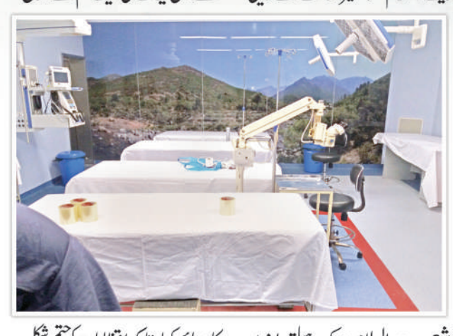
شعبے بیت السلام بیسک ہسپتال یونٹ کا معائنہ کیا، تاکہ انتظامات کو جتنی شکل دے سکیں اور باہر ایک دی جا سکے۔

☆ گوارڈریٹ اسلام بیسک ہسپتال کی سعادتی بیت السلام بیسک ہسپتال یونٹ کی ٹیم نے اس سے قبل کوئی آئی کیمپ نہیں لگ سکا، آپریشن تو بہت دور کی بات ہے۔ ☆ معائنے کے دوران جن افراد کی نظر کمزور محسوس ہوئی انہیں مفت چشمہ دیا گیا۔ ☆ آپریشن کے دوران استعمال ہونے والی آلات کی صفائی کا خصوصی اہتمام کیا جاتا رہا۔ ایسے تمام آلات ہر آپریشن کے فوراً بعد اسپرٹ سے دھوئے جاتے رہے۔ ☆ آپریشن کے لیے لے جانے والے مریضوں کی دل جوئی کی جاتی رہی اور ان سے باتیں کی جاتی رہیں، انہیں ایسا ماحول دیا گیا کہ اگر کوئی خوف ان کے ذہن میں ہو تو نکل جائے، رضا کار اور میڈیکل اسٹاف اپنی محنت اور کوشش میں کامیاب رہا۔ الحمد للہ! ☆ بہت سے مریض دور دراز علاقوں سے تقریباً پانچ پانچ، چھ چھ گھنٹے کا لمبا سفر کر کے آئے ہیں۔ ☆ کیمپ کے پہلے روز گوارڈریٹ میں ہی پاکستان چائنہ کمیٹی کے منصوبے پر کام کرنے والے ایک چینی انجینئر بھی آگے چیک کروانے تشریف لائے۔ اور ایسے خیالات لے کے گئے۔ ☆ GDA Development Authority کے زیر انتظام اس ہسپتال کے متعدد انتظامی امور پاکستان آرمی نے سنبھال رکھے ہیں۔ ☆ کیمپ کے دوران مختلف علاقوں کے رہنے والوں نے اس خواہش کا اظہار کیا کہ ان کے علاقے میں بھی ایک ایک ایسا کیمپ لگائیں وہاں بھی اس کی بہت ضرورت ہے۔