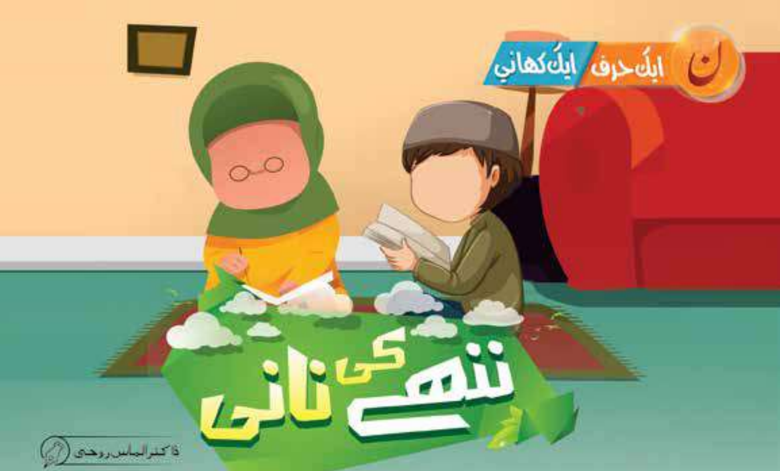
ڈاکٹر الیاس روحی