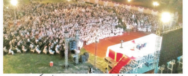
جامعہ بیت السلام فیروز کوٹ نے 7 ویں سالانہ جلسے کا ایک منظر

کراچی (پ ر) بیت السلام ویٹھیر ٹرسٹ الغوطہ کے متاثرین کے لیے ترک رفاہی ادارے نے آئی کے ڈریس فور ریفیو کا اہتمام کرنے کے لیے محفوظ شاہی علاقوں میں 200 خیموں کی تنصیب کر رہا ہے، یہ خیمے خاص طور پر باقی صفحہ نمبر 01