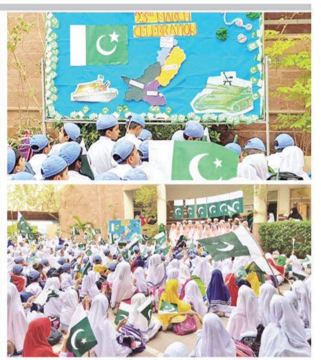
23 مارچ کے موقع پر اٹلیک اسکول میں بچوں کی سرگرمیاں