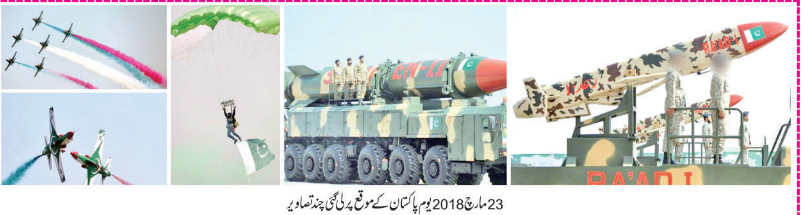
23 مارچ 2018 یوم پاکستان کے موقع پر نئی ہتھیاروں کا مظاہرہ

بیت السلام اور دیگر شاہی علاقوں میں زخمیوں اور بچوں کو نکلنے کے لیے ترک رفاہی اداروں کے توسط سے اقدام