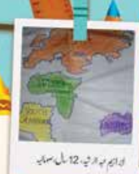
ادبیم، 12 سال، سوہیہ