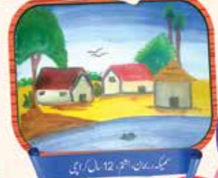
مہین، 12 سال، کراچی