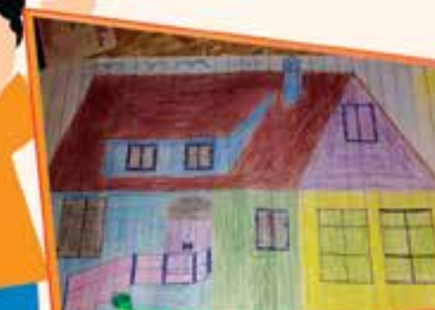
مہین، 10 سال، کراچی