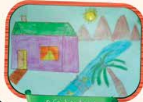
مہین، 9 سال، کراچی