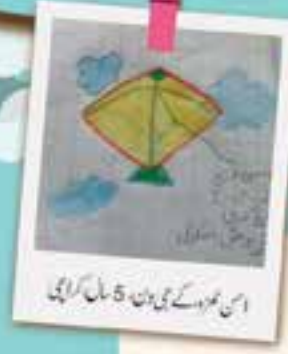
اس نمبر کے ہی دن، 5 سال، کراچی