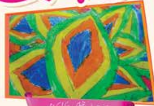
مہین، 11 سال، انجلیت اعلیٰ، کراچی