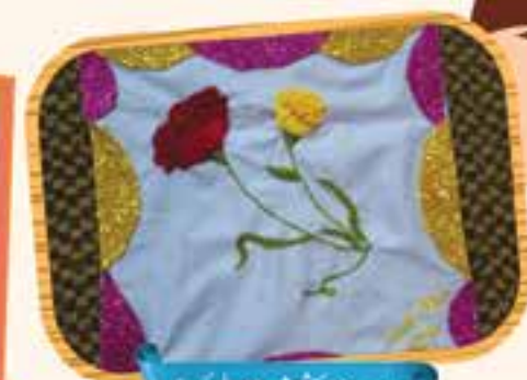
مہین، 12 سال، کراچی