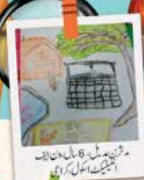
مرثین، 8 سال، دن اظ انجلیت اعلیٰ، کراچی